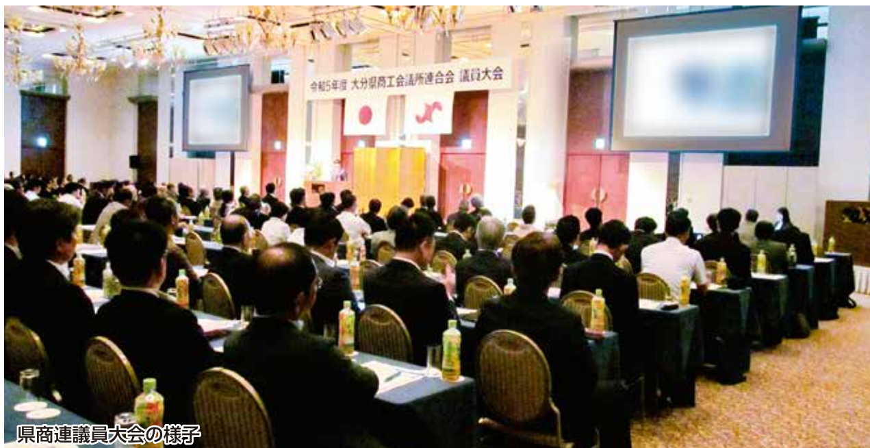
県商連議員大会の様子