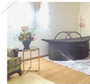
Ayurveda & BIHADA salon Ojas

美肌と健康を守ることを目的としたエステティックサロンで、東洋の予防医学であるアーユルヴェーダの知識などから作ったメニューが特徴です。デトックスやストレス軽減・免疫力を高めるアーユルヴェーダの