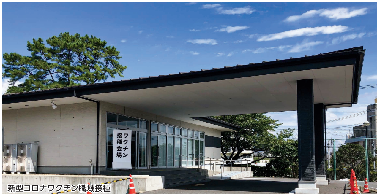
新型コロナワクチン職域接種