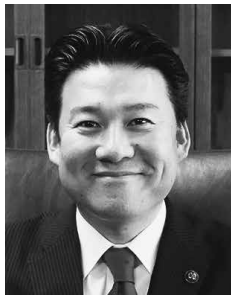
別府市長 長野 恭紘