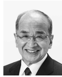
大分県知事 広瀬 勝貞