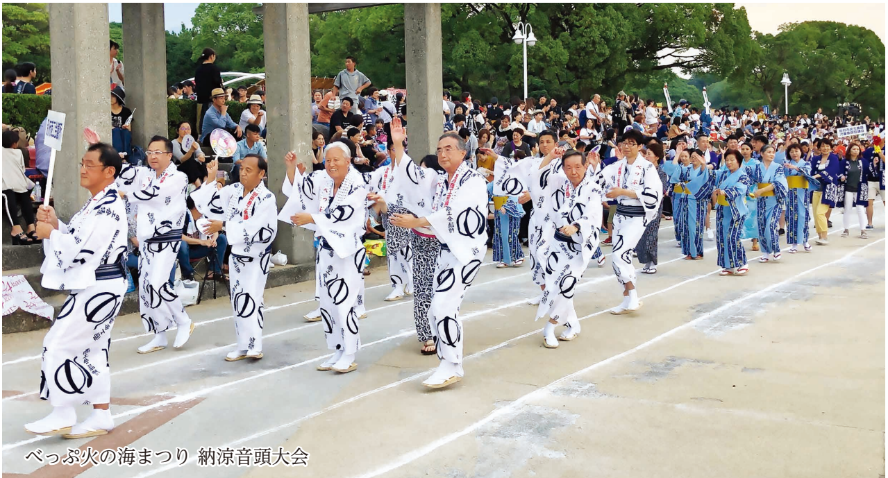
べっぶ火の海まつり 納涼音頭大会