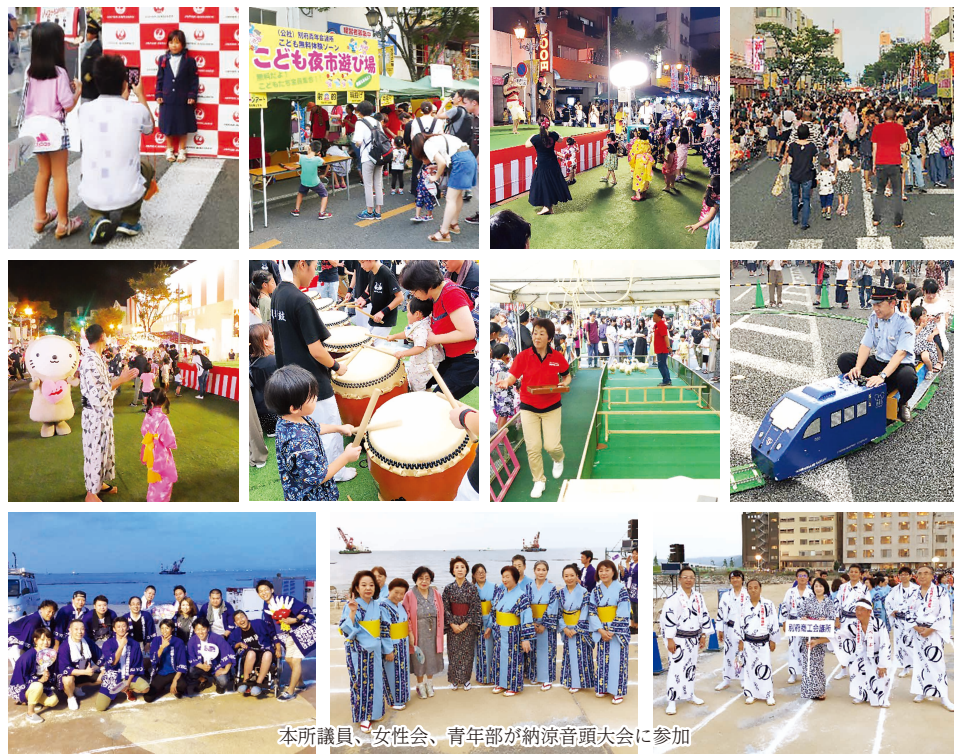
本所議員、女性会、青年部が納涼音頭大会に参加

7月26日27日の2日間、べっぷ夜市を開催した。本年度は、「子どもたちが主役」をコンセプトに子どもが思いっきり楽しめるよう体験や遊びなどのスペースを設置。県下商工会議所紹介のうまいものエリアや動物ふれあいエリア、無料遊びエリア、体験レッスンエリアなど駅前通りは例年とは違った雰囲気だにぎわった。