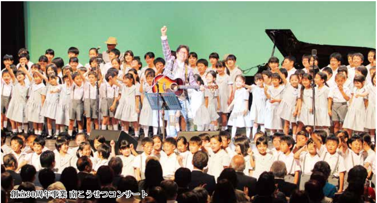
創立90周年事業 南こうせつコンサート