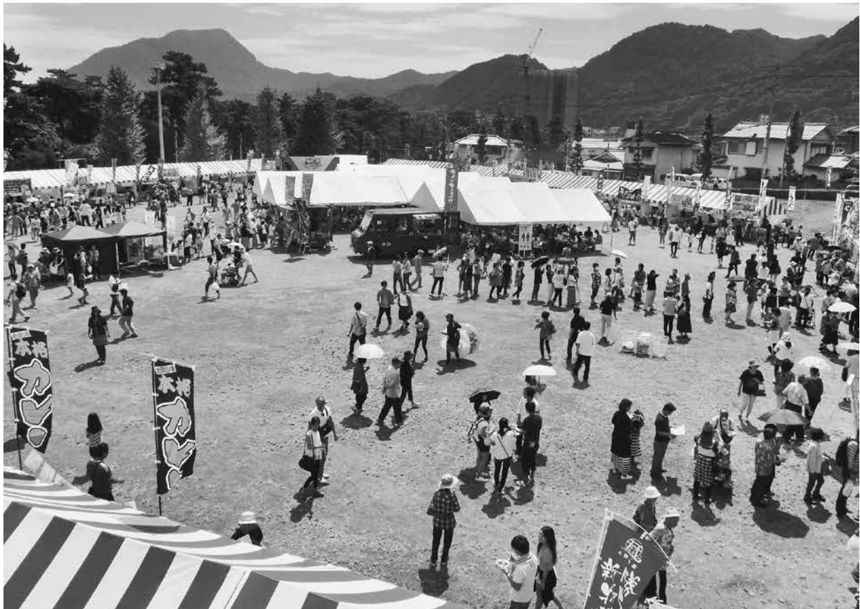
九州食の大宴会の様子