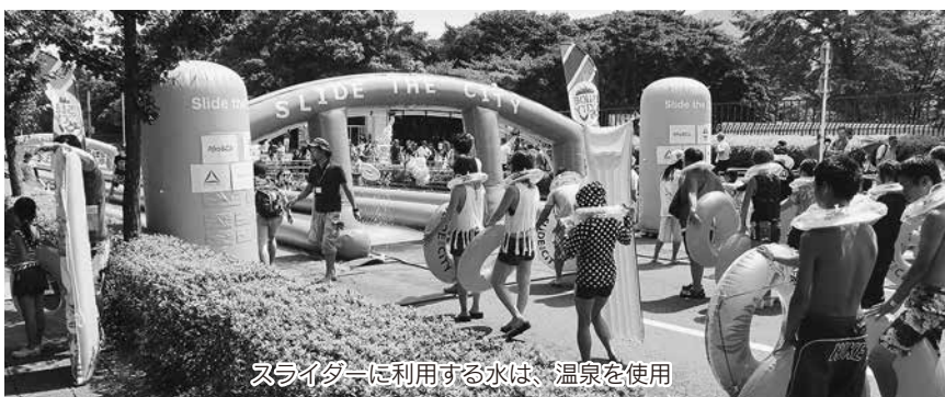
ライダーに利用する水は、温泉を使用

また、会場のすぐ近くでは、CMで話題、九州で初めての開催となるウォーターズライダーが富士見通りの一部を封鎖して登場し、幅広い世代で楽しめるイベントとなり賑わった。