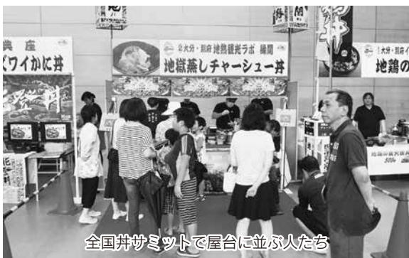
全国丼サミットで屋台に並ぶ人たち

今年では会場を一部屋内へうつしたことで、海の幸を新鮮なままで提供できるようになり「全国丼サミット」も同時開催することができ、2日間で8万人を超える来場者数となった。