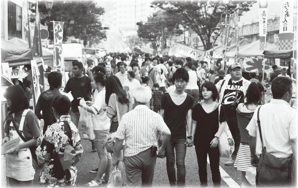
ワイワイ市で大賑わいの別府駅前通り