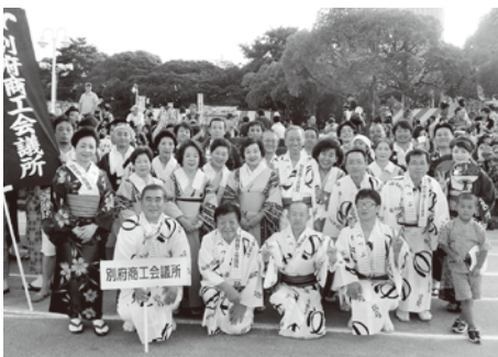
参加した本所連メンバー

7月27日にスパビーチで納涼音頭大会が行われ、商工会議所から議員、女性会、青年部ら約30人が参加した。