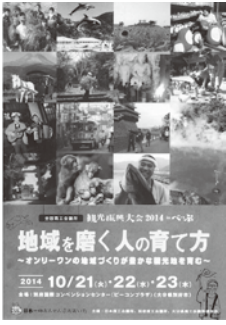
振興大会パンフレット

しかない、温泉やおもてなしで、県内外にアピールする絶好のチャンス。開催するだけにとどまらず、次に上げる大会にしたい。