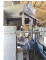
有機食品の製造ライン（茶葉→荒茶への製造ライン）