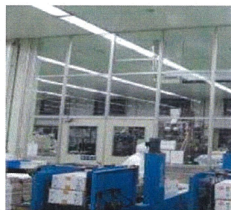
空気を經由した汚染の防止設備（パーティション）の導入