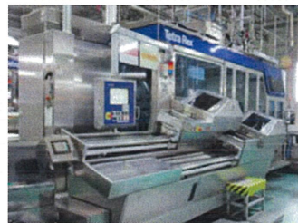
ESL製法（賞味期限の延長）のための装置