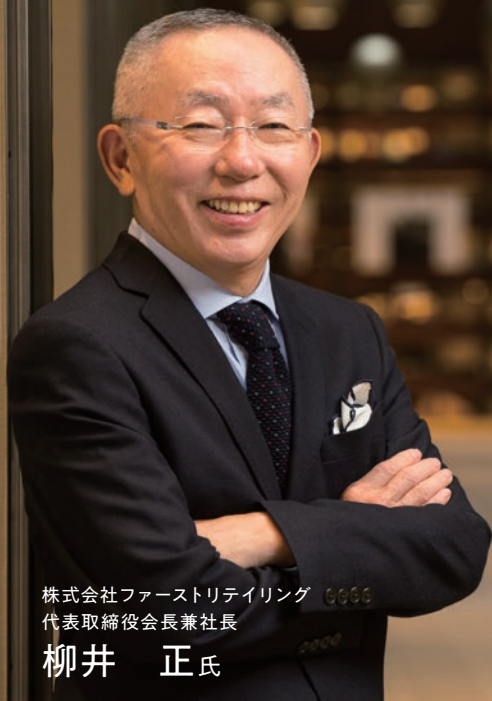
株式会社ファーストリテイリング 代表取締役会長兼社長 柳井 正氏

コロナ禍で奮闘している会員企業、地域の最前線で会員企業を支援している各地商工会議所が、ともに未来への希望を持って、これからの時代を生き抜いてくために、各方面で活躍されている方々をお招きし、オンラインによる特別記念講演会を開催します。