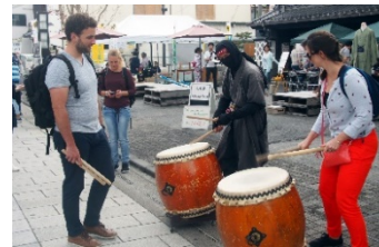
伝統文化を活用した 体験イベント