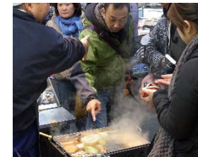
ローカルな食を活かした 食べ歩きイベント