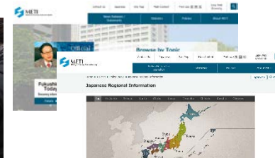
イベントとあわせ 外国語によるHPやSNS等を 駆使した情報発信