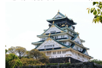
城郭・史跡・名所