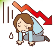
失敗したときのリスク