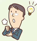
知識、ノウハウの不足